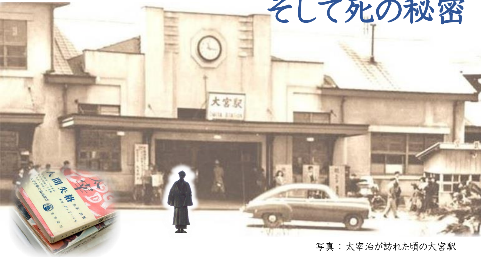
写真：太宰治が訪れた頃の大宮駅